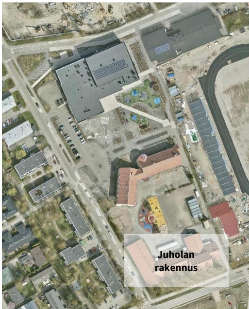
Kuva 2, Vaiheen III valmistuessa JYK:n käytöstä poistuva rakennus.

Vaiheen III valmistuttua tontin eteläpuolella olevasta Juholan rakennuksesta luovutaan (kuva 2). Juholan rakennuksen jatkokäyttö ja tontin mahdollinen lohkominen ei sisälly JYK hankkeeseen.